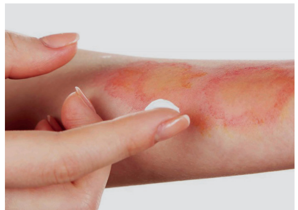
Editada de Brandwonden - Dermavisie Huidtherapie

Además, la aplicación de sulfadiazina de plata en zonas extensas o por tiempo prolongado, puede generar pseudocicatrización por la interacción del fármaco con el exudado proteico y, en casos más severos, puede llegar a producir argiria.